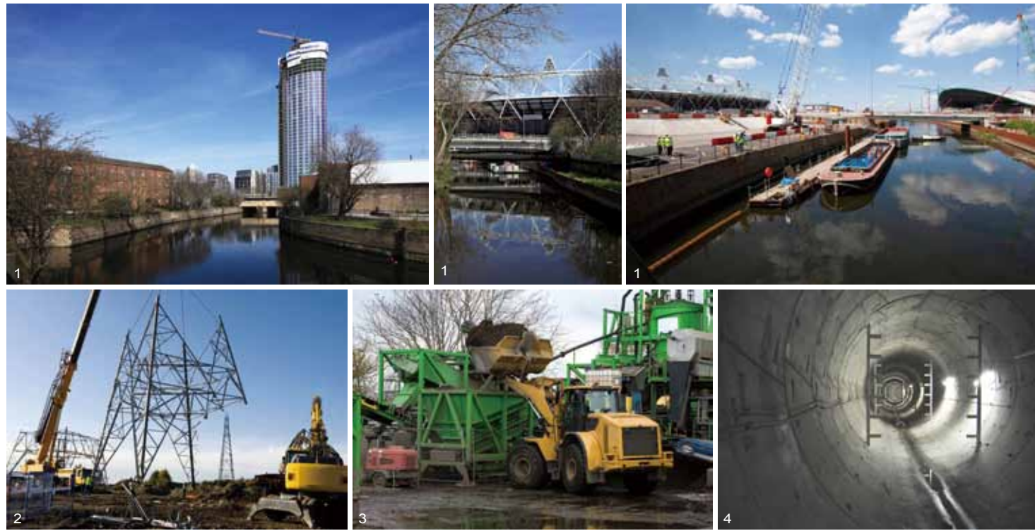
1. 整治後的利亞河水道，圖片提供由左至右為 (d) (d) (b)。 2. 拆除地上高壓電塔 (b) 3. 汙染土壤淋洗整治 (c) 4. 新設地下電纜涵管 (c)

3)，只能提高公部門投資金額以確保相關計畫能順利進行，而這也讓整個計畫的公眾效益更受到爭議與關注。況且如此大規模的投資，光靠賽會期間的各項收入是不可能回收的，那英國政府到底期待奧運能帶來什麼或留下什麼？