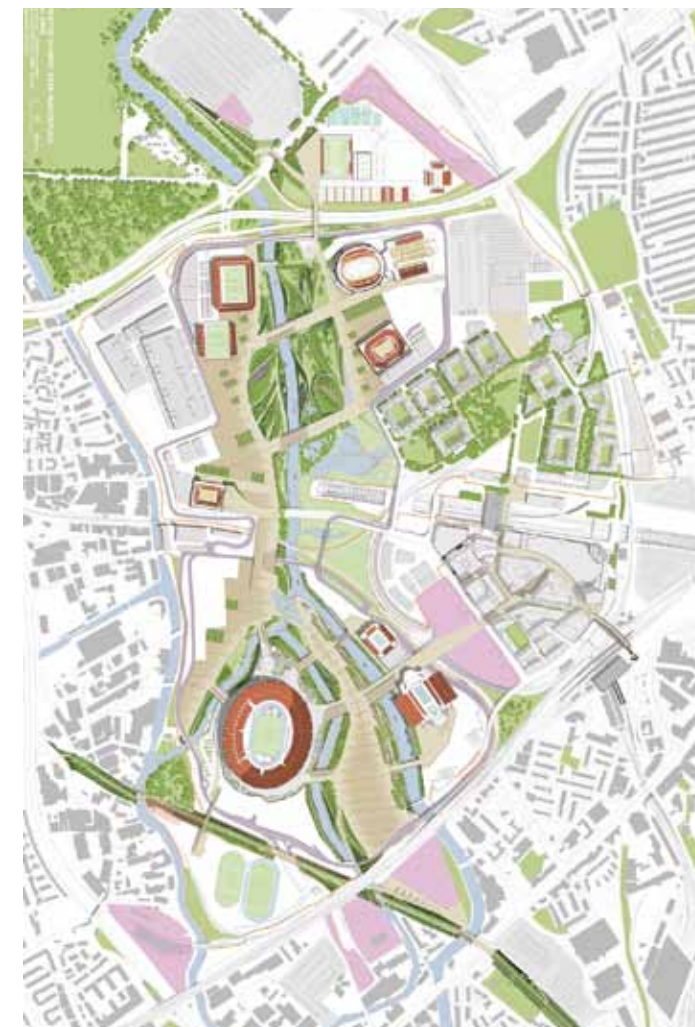
奧運期間的園區配置圖