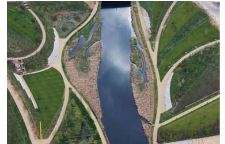
帶狀河岸公園與景觀系統 (a)

奧運園區西側的能源中心將提供園區及未來新社區的電力、加熱與冷卻；包括一個三百萬瓦（MW）以木屑為燃料的生質鍋爐，每年可以減少1000噸碳排放量；以及一個使用天然氣的冷熱電聯供系統（CCHP）；CCHP系統的燃料利用效率超過70%，比起傳統火力發電的40%要有效率得多。預計能源中心每年將可以減少25%的碳排放量。