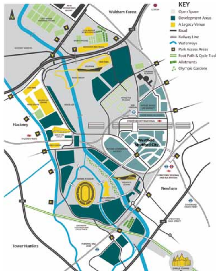
後奧運時代，續存場館與開發社區及交通動線上的關係。