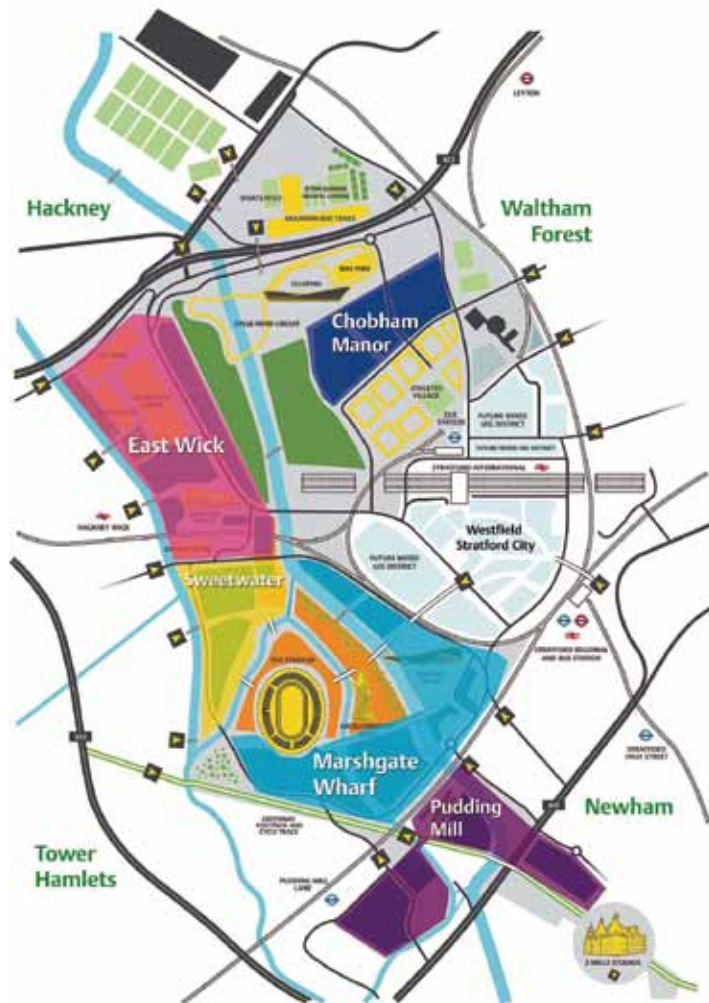
未來園區內五個新社區的位置與各場館之間的關係 (b)

位於園區東北側緊鄰選手村的Chobham Manor (9.3公頃) 將是首先招標的住宅區，目前已從六家投標廠商中篩選出三家進行第二階段評選，預計2014年完工。其中包含八百戶住宅 (70%為家庭式住宅)、兩間托兒所、社區中心以及將在2013年招生的Chobham Academy (3-19歲)；其他四個住宅區也預計於在五年之內完成。