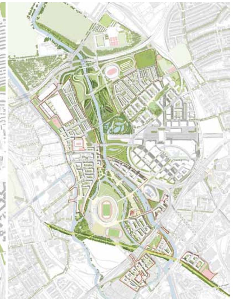
(b) 奧運結束拆除臨時場館後與植入新社區的配置圖